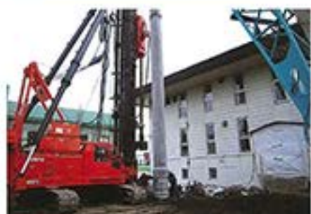
3月10日 こんなに大きな杭が何本も打ち込まれました。