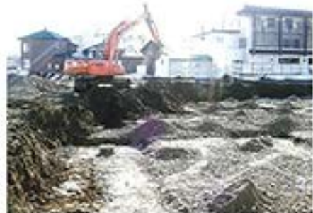
3月28日 土台が重機で掘られていきます。