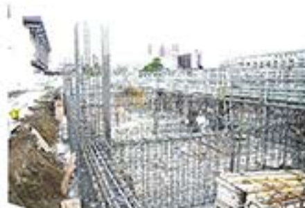
4月19日 基礎コンクリートの中にはこれほどの鉄筋が編みこまれています。