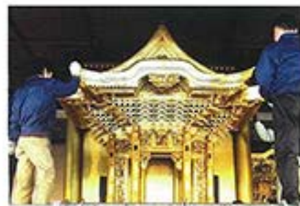
2月8日 ご修復のため、京都の職人さんによって搬出されました。