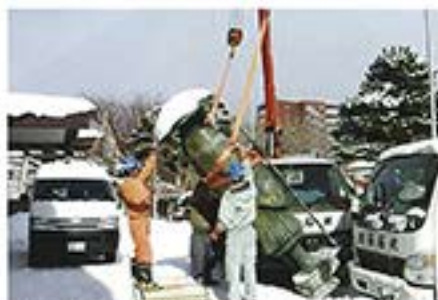
2月8日 親鸞聖人像の移設。初めて分かった背の高さに驚きです。