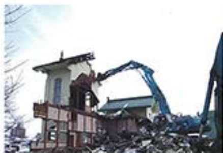
2月23日 ついにシャベルがかかった瞬間。今までありがとうございました。