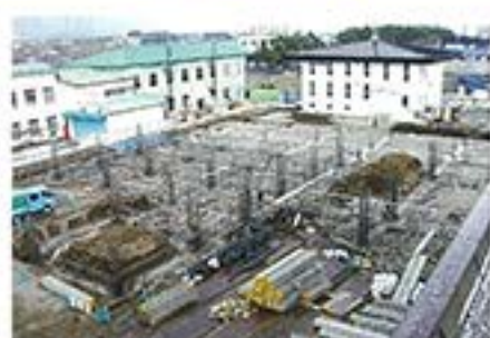
4月9日 基礎の上に鉄筋が組まれています。