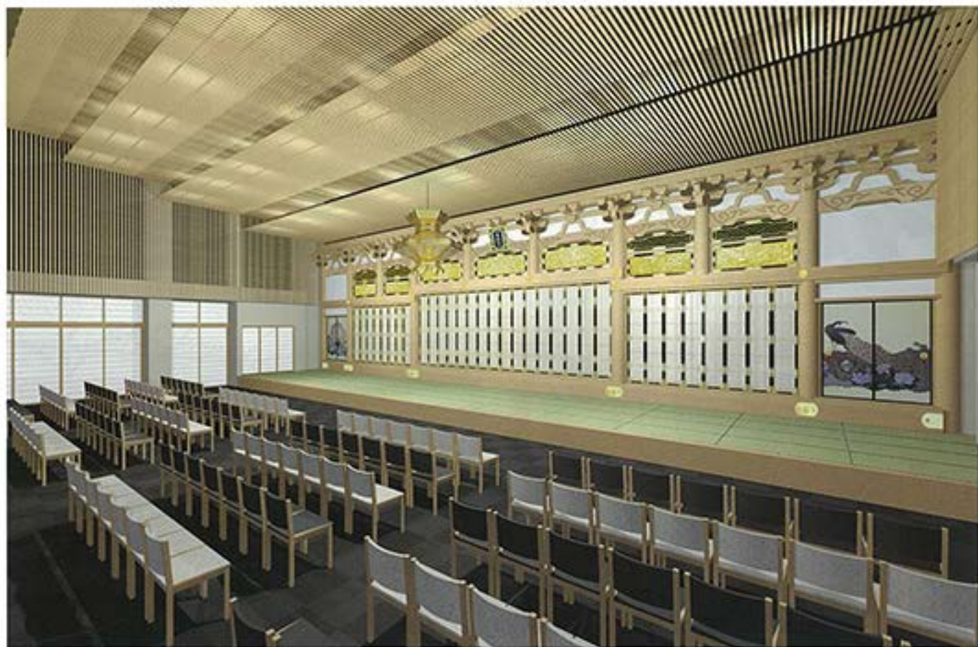
新本堂内完成予定図