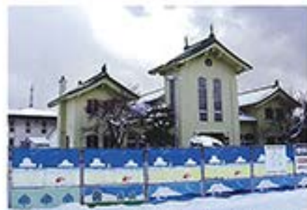
2月19日 今では懐かしい旧本堂の姿。