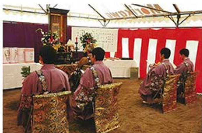
陰山輪番導師の下、厳かに読経。