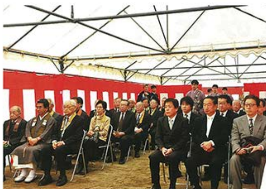
式参列者と入場する別院僧侶