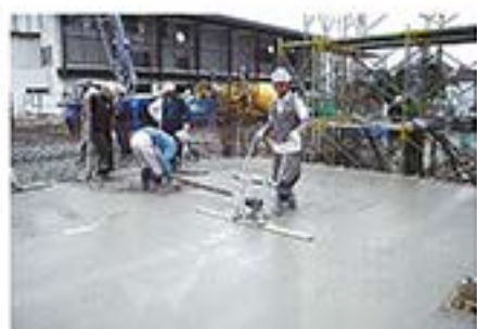
5月19日 床のセメントが塗られています。