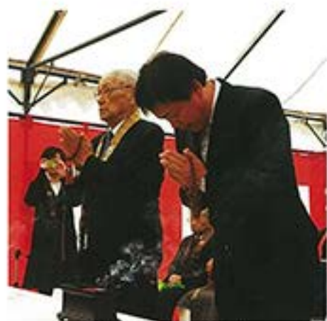
参列者によるお焼香