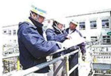
4月18日 工事スタッフのみなさんによる、現場での入念な打ち合わせ。