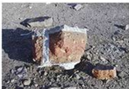
解体中、旧本堂よりさらに前の本堂のレンガが出てきました。