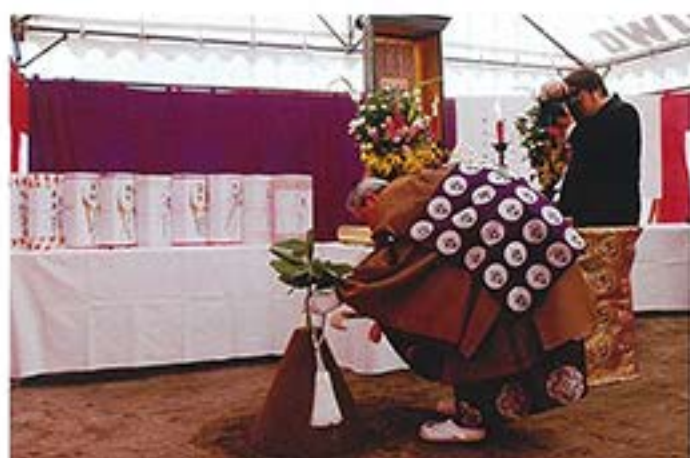
鎌入れ式。まずは陰山輪番による鎌入れ。