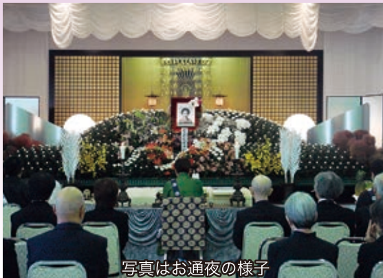
写真はお通夜の様子

西別院文化会館はお葬儀会場として小規模より大規模な通夜葬儀まで、ホール・和室などご希望に応じて様々な部屋を用意しております。会場はすべてイス席です。詳細はお寺までお問い合わせください。