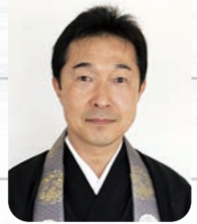
北海道教区 札幌組 覚英寺