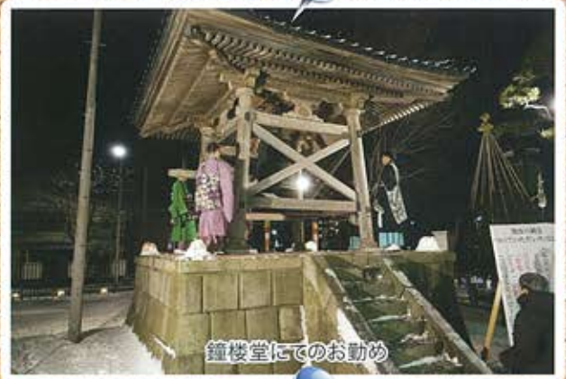
鐘楼堂にてのお勤め