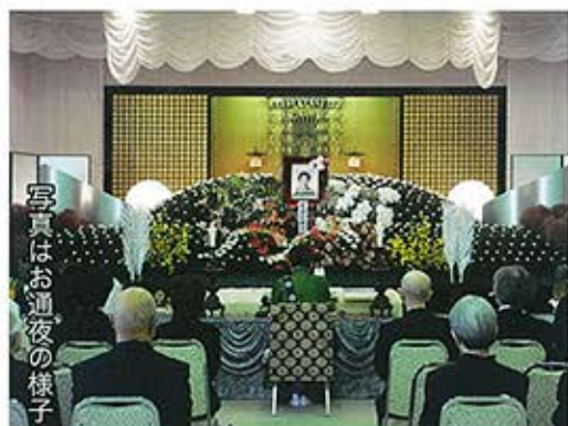
写真はお通夜の様子