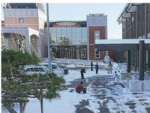
ボーイスカウトによるスノーキャンドルの制作