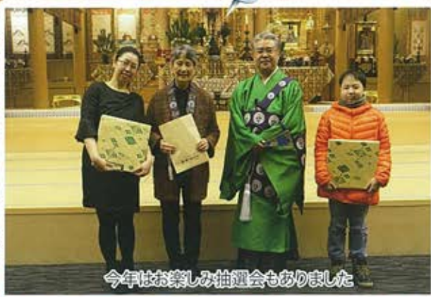
今年はお楽しみ抽選会もありました