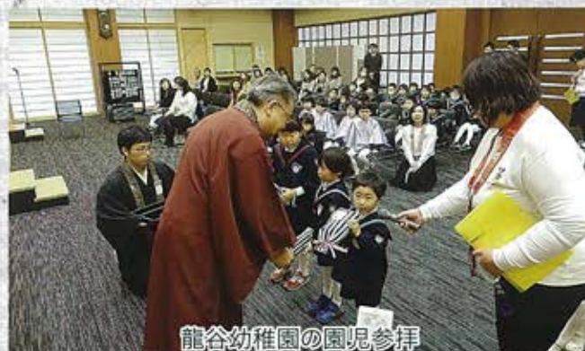
龍谷幼稚園の園児参拝