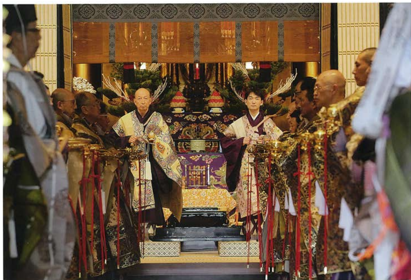
尊前で焼香された後、阿弥陀堂から縁儀されるご門主と前門さま