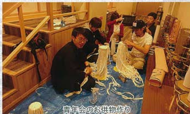
青年会のお供物作り