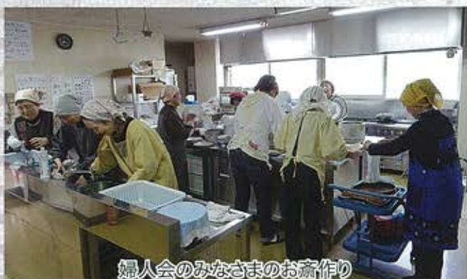
婦人会のみなさまのお斎作り