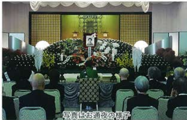
写真はお通夜の様子