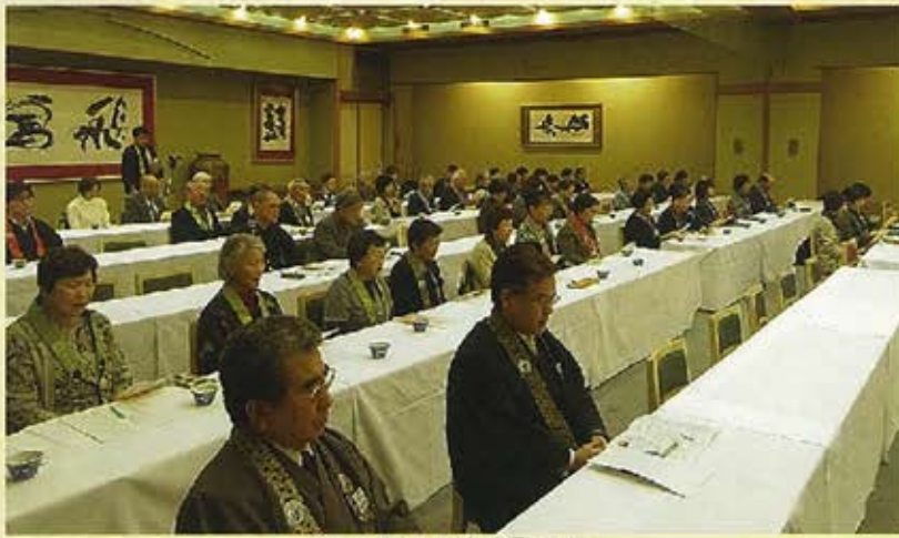
一緒に真宗宗歌を♪