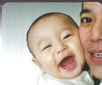
参勤部 谷 一讓

北関東の親鸞聖人二十四輩巡り！ 国府の恵信尼公ご廟所！ 鹿児島島の隠れ念仏の旧跡！