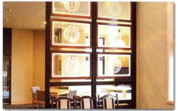
新本堂にある仕切り

一方、ロビーから文化会館への通路へ目を向けると、談話スペースとの境い目をつくっている仕切りが。そこには浄土真宗本願寺派の「下がり藤」が描かれたガラスが数枚使われています。こちらは見覚えあるという方は多いのではないのでしょうか。こちらも旧本堂で使われていました。引き戸と天井との間、外陣をぐるりと囲むように取り付けられていたガラスの内の数枚が使われています。