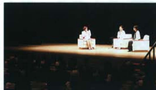
ご講師同士の鼎談