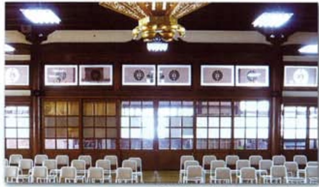
旧本堂で使われていたガラス

旧本堂の解体作業は、とても丁寧な過程を経て行われました。一つ一つの部品を次の本堂で使えるかどうかを吟味し、その中でこれらの虹梁と下がり藤のガラスは貴重なもののひとつとして残されることになりました。ただの再利用ということにとどまらず、その趣のある存在感は、現在の本堂が新しい故にまだ持ち得ない雰囲気を補うための新たな役割りを担っているかのようです。