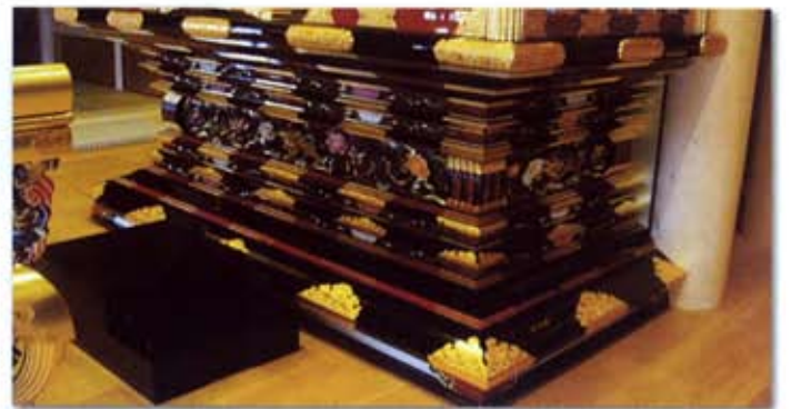
新しくなった須弥壇

引き継がれていった、という意味では本堂内陣の仏具がまさにそうです。参拝席から見ると本堂の内陣は、あらゆる仏具が新品のように金色に輝いています。ところがこの仏具は、阿弥陀様の御像を支える壇(須弥壇)と阿弥陀様と向き合っている側の机(御代前の前卓)以外は、すべて旧本堂で使われていたものです。以前の須弥壇は本当は小さいサイズのもを無理に