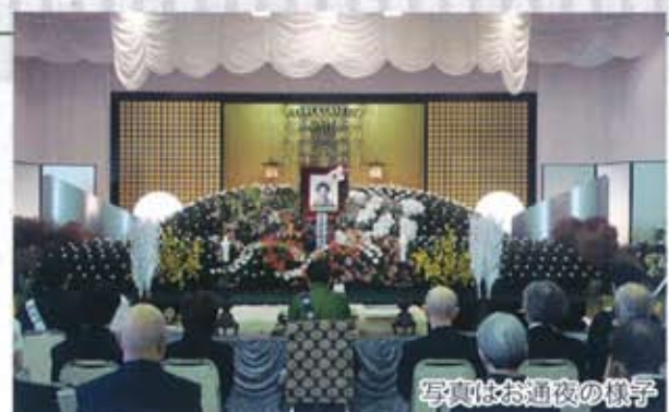
写真はお通夜の様子