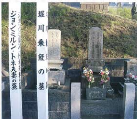
姫川乗経師のお墓