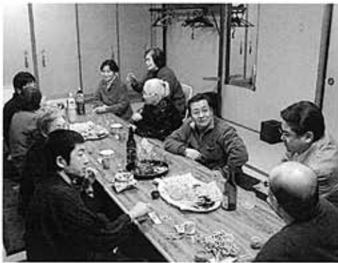
中央仏教学院通信教育・ 仏教に学ぶ会合同 報恩講・一泊研修 (2月8～9日)