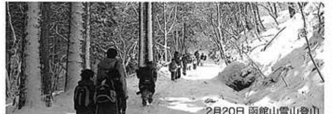
2月20日 函館山雪山登山

2月6日、西別院でボーイスカウトとガールスカウトの函館地区交歓大会がありました。私が一番楽しかったのは玉入れゲームです。2回戦とも私のチームが勝ちました。友達もボーイスカウトとガールスカウト合わせて3人できました。とってもうれしかったです。大会が終わると、隊長に「いちばん楽しそうだったね」と言われました。来年の大会もぜひ参加して、楽しく遊んで、友達をもっともっと増やしたいです。