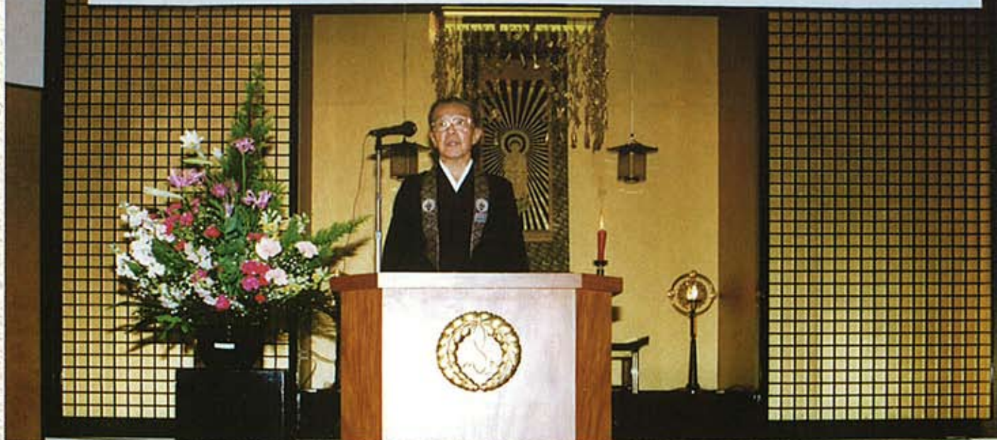
H4.10 常和臺落慶式典並びに祝賀会