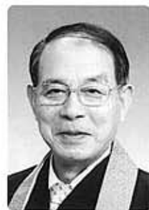
滋賀教区 愛知上組 蓮照寺