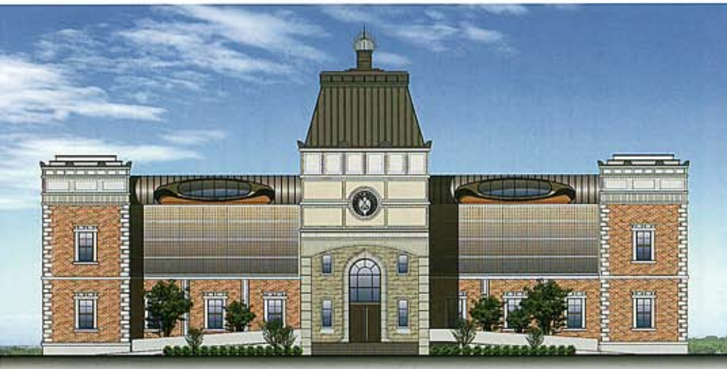
平成のモダン寺 完成イメージ