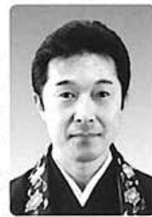
北海道教区 札幌組 覺英寺