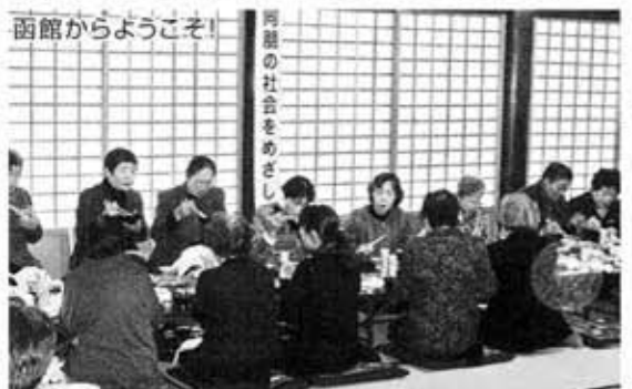
函館からようこそ!