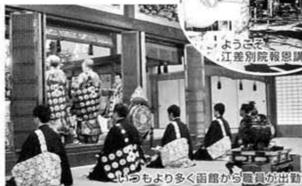
いつもより多く函館から職員が出動