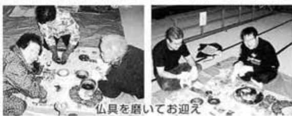
仏具を磨いてお迎え