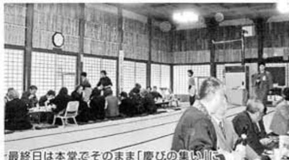
最終日は本堂でそのまま「慶びの集い」に