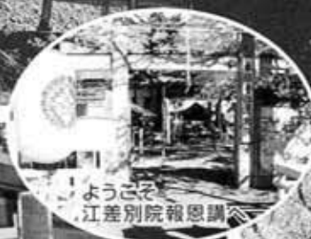
イチョウがキレイなこの時期