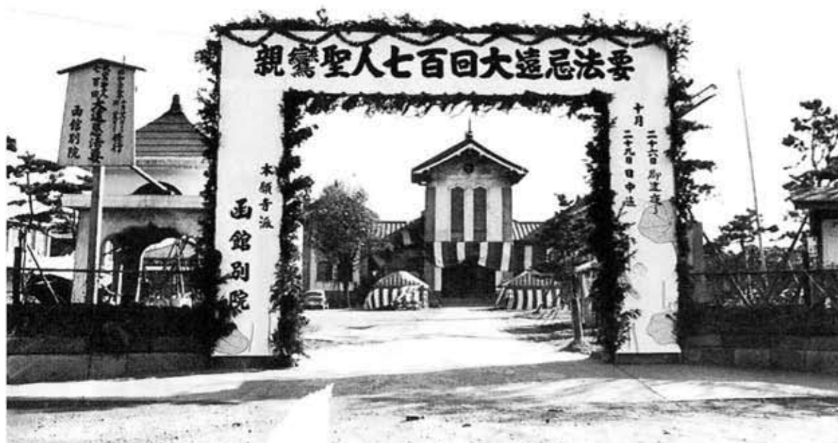
昭和39年(1964)年10月26~29日 函館別院 親鸞聖人七百回大遠忌法要