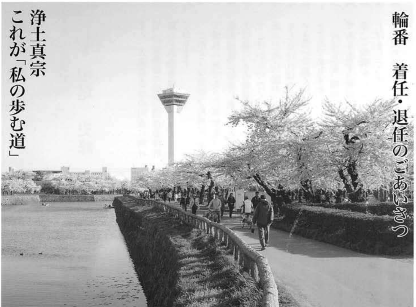
さくら色の街(五稜郭公園)