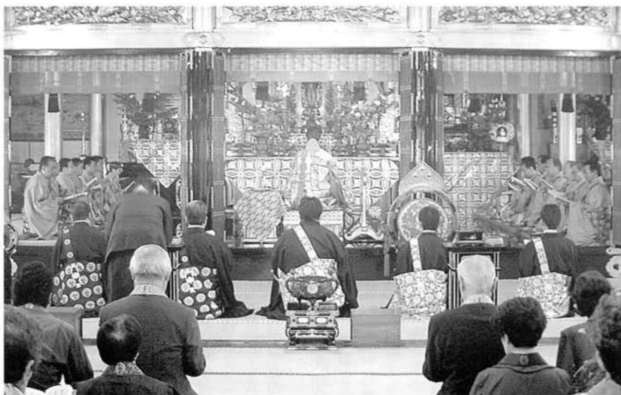
平成18年度 報恩講 満日中法要