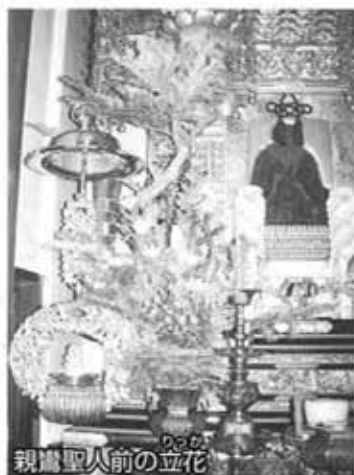
親鸞聖人前の立花